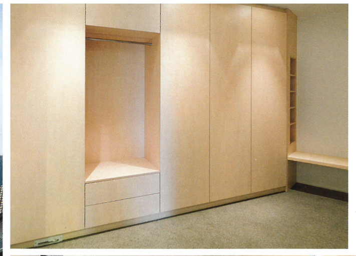
Von Alpina gefertigte Garderobe mit Terrazzo-Estrich von Fischer in Hard.