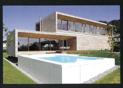
Für jedes Budget das passende Traumhaus