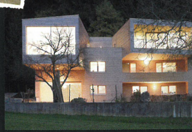
Die sichere Wertanlage – durch Umbau und Sanierung