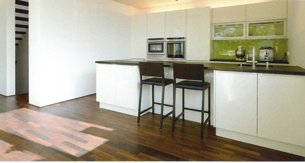
Die Küche hat eine Inselbar und eine Arbeitsplatte aus Nero Assoluto. Sie wurde vom Wohnstudio Wachter gefertigt.

as sonnige, in leichter Hanglage und Familienbesitz befindliche Grundstück, sollte neu bebaut werden. "Mein Elternhaus stand an diesem Platz", erläutert der Bauherr, "Ende 2010 haben wir es abgerissen und dann mit dem Bau des dreigeschossigen neuen Einfamilienhauses begonnen. Bereits im August 2011 war es bezugsfertig!" Der mächtige, alte Nussbaum im Garten macht aus dem zur Gänze in Lärche gehüllten Neubau ein Ensemble aus Holz in lebendiger und perfekt verarbeiteter Form. "Uns hat das Baumaterial Holz immer schon sehr angesprochen", sagt die Bauherrin, "wir fühlten uns in Holzhäusern einfach am wohlsten. Diese Behaglichkeit und Wärme wollten wir unbedingt auch für unser Haus". Auf