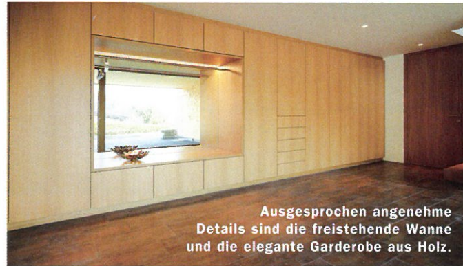
Ausgesprochen angenehme Details sind die freistehende Wanne und die elegante Garderobe aus Holz.

körper mit einer extrem gut gedämmten Außenhülle, die dem Gedanken des Energiesparens Rechnung trägt. Den ökologischen Aspekt zeitgemäßen Bauens erfüllen sowohl Form als auch Technik. Beiden liegt höchster Anspruch zugrunde, was ein behagliches Raumklima zur Folge hat. Bei den Ausstattungsdetails, wie Böden, Türen und Fenster legen Bauherren und Alpina Bau viel Wert auf qualitätsvolle Ausführung. Eine äußerst effiziente Luftwärmepumpe mit integrierter Komfortlüftung sorgt für geringe Energiekosten bei stets besten Bedingungen. Zurückhaltung bei der Materialauswahl, perfekte Proportionen und stilichere Beleuchtung runden das klar strukturierte Objekt sehr anscheinlich ab. ■