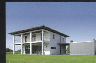
Für jedes Budget das passende Traumhaus