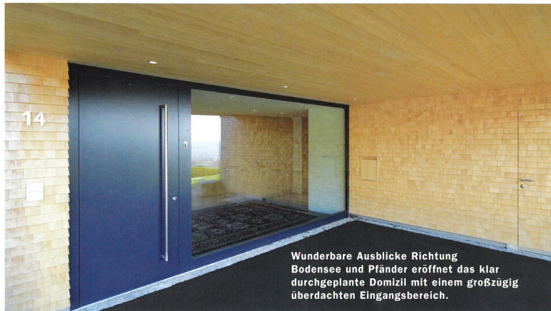
Wunderbare Ausblicke Richtung Bodensee und Pfänder eröffnet das klar durchgeplante Domizil mit einem großzügig überdachten Eingangsbereich.