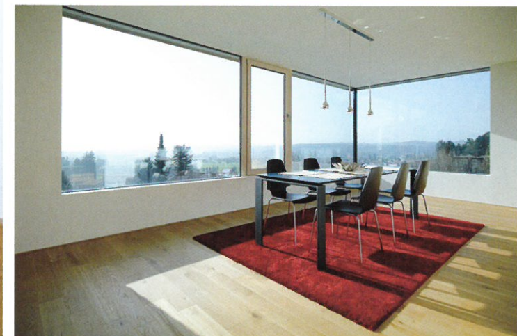
Sonnige Räume und Fensterausschnitte wie gerahmte Bilder machen Wohnen zu einem Erlebnis der Jahreszeiten. Für die effektive Beschattung sorgten die Experten von Giessmann.

erzeugt großzügige Einschnitte, die für eine überdachte Terrasse und einen Autounterstellplatz genützt werden. Die exponierte Lage des Domizils ermöglicht atemberaubende Ausblicke zu Bodensee und Pfänder.