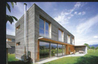
Ein Passivhaus ist wohnen mit Zukunft

Unsere Häuser haben ein starkes Fundament aus Erfahrung, werden mit Verlässlichkeit gebaut und bringen jedes Budget ganz fix unter Dach und Fach. Ökologisches Bauen sowie das Passivhaus aus Zimmermeisterhand sind unser Spezialgebiet. Wir realisieren Hausräume und sind auch in Sachen Sanierung und Umbau der richtige Partner. Vertrauen Sie uns - Bauen Sie mit ALPINA.