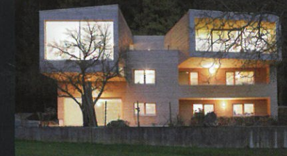
Die sichere Wertanlage – durch Umbau und Sanierung